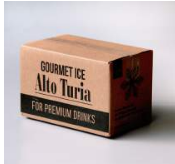
PACK 10 KG 5 BOLSAS X 2K