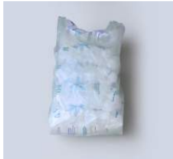
PACK 10 KG 5 BOLSAS X 2K