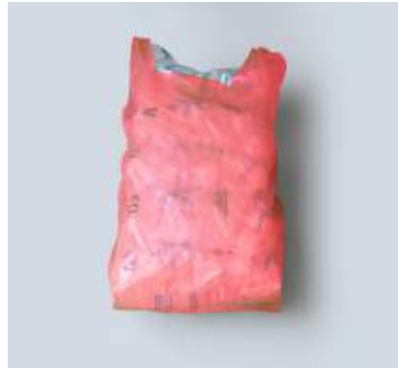
PACK 10 KG 5 BOLSAS X 2K