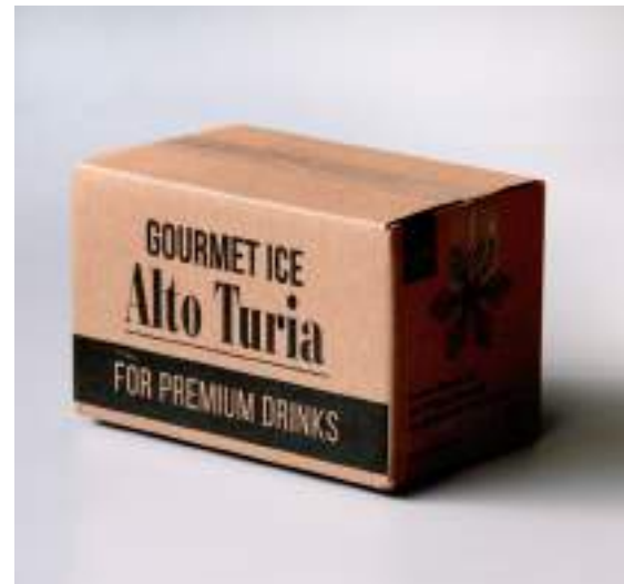
PACK 10 KG 5 BOLSAS X 2K