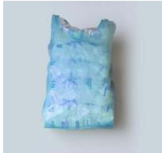
PACK 10 KG 5 BOLSAS X 2K