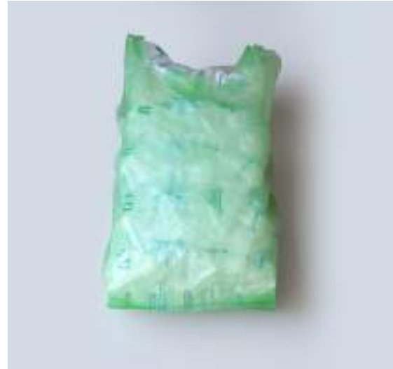
PACK 10 KG 5 BOLSAS X 2K